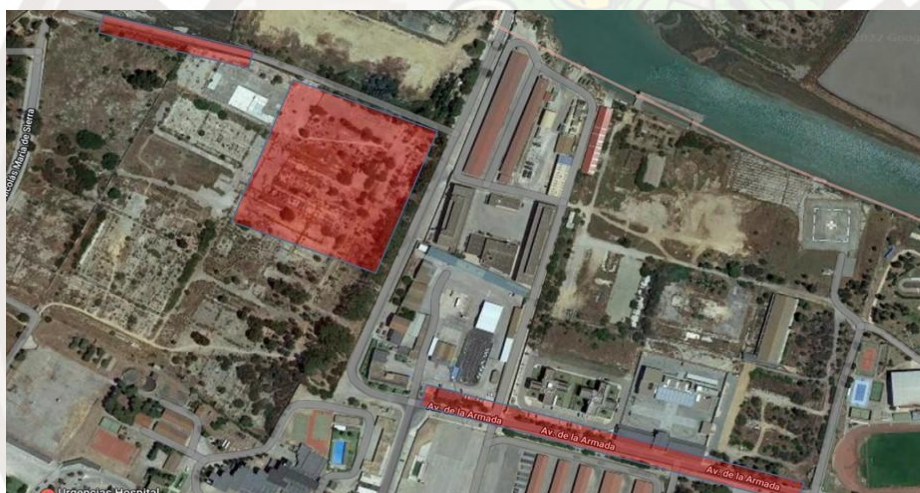
Zonas de aparcamiento recomendadas: Avenida de la Marina; antigua fábrica de San Carlos y camino al Cementerio de los Ingleses

La Organización podrá interrumpir la prueba en cualquier punto si considera que puede haber peligro para la integridad física de los participantes. En caso de que el mal tiempo o alguna otra eventualidad desaconseje la realización de algún tramo de la ruta se modificará el itinerario, informando y guiando a los participantes hacia el nuevo trazado.